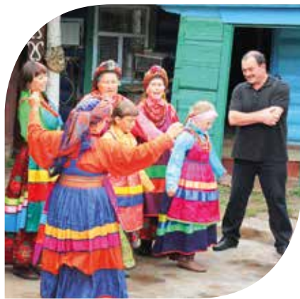
Три села Бурятии (Большой Куналей, Десятниково, Ярикто) входят в список самых красивых деревень России.