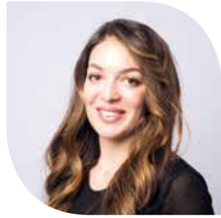
ЗАРИНА ДОГУЗОВА, руководитель Федерального агентства по туризму