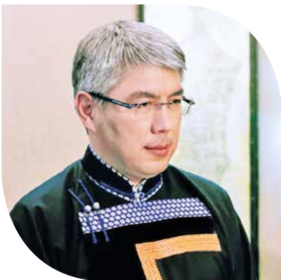
АЛЕКСЕЙ ЦЫДЕНОВ, Глава Республики Бурятия – Председатель Правительства Республики Бурятия