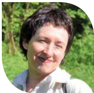
ИВА ЛЕБЕДЕВА, президент Национальной ассоциации сельского и экотуризма (Москва)